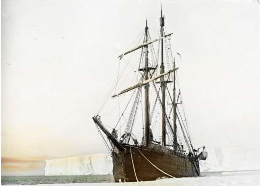
Fram vid Valbukten 1910