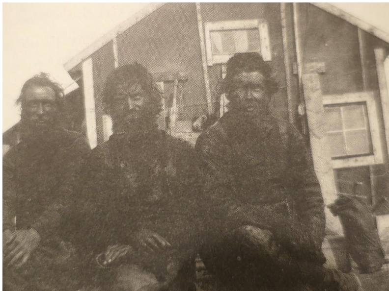
De tre som övervintrat i en stenhydda vid Hoppets vik Åter vid Snow Hill. Expeditionens bas. 1903

Otto Nordenskjöld, systerson till Adolf Nordenskjöld som genomseglade nordostpassagen, var född den 6 december 1869 och dog oturligt, påkörd av en buss i centrala Göteborg den 2 juni 1923 vid 58 års ålder. (16 dagar före Roald Amundsens död under dennes eftersökning efter överlevande efter Nobiles haveri med luftskeppet Italia.)